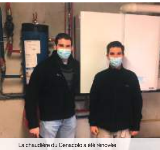
La chaudière du Cenacolo a été rénovée