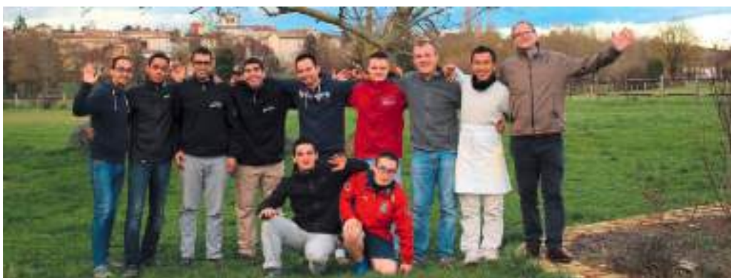
Le Cenacolo accueille des jeunes hommes frappés par des addictions

Ils sont mobilisés pour les travaux intérieurs des bâtiments existants, l'embellissement extérieur de la maison, l'entretien des espaces verts et surtout l'entretien du potager qui occupe une grande partie du terrain mis à disposition par la Fondation Saint-Irénée. Ils vivent principalement sur leur production de fruits et de légumes, issus des pratiques vertueuses de la permaculture.