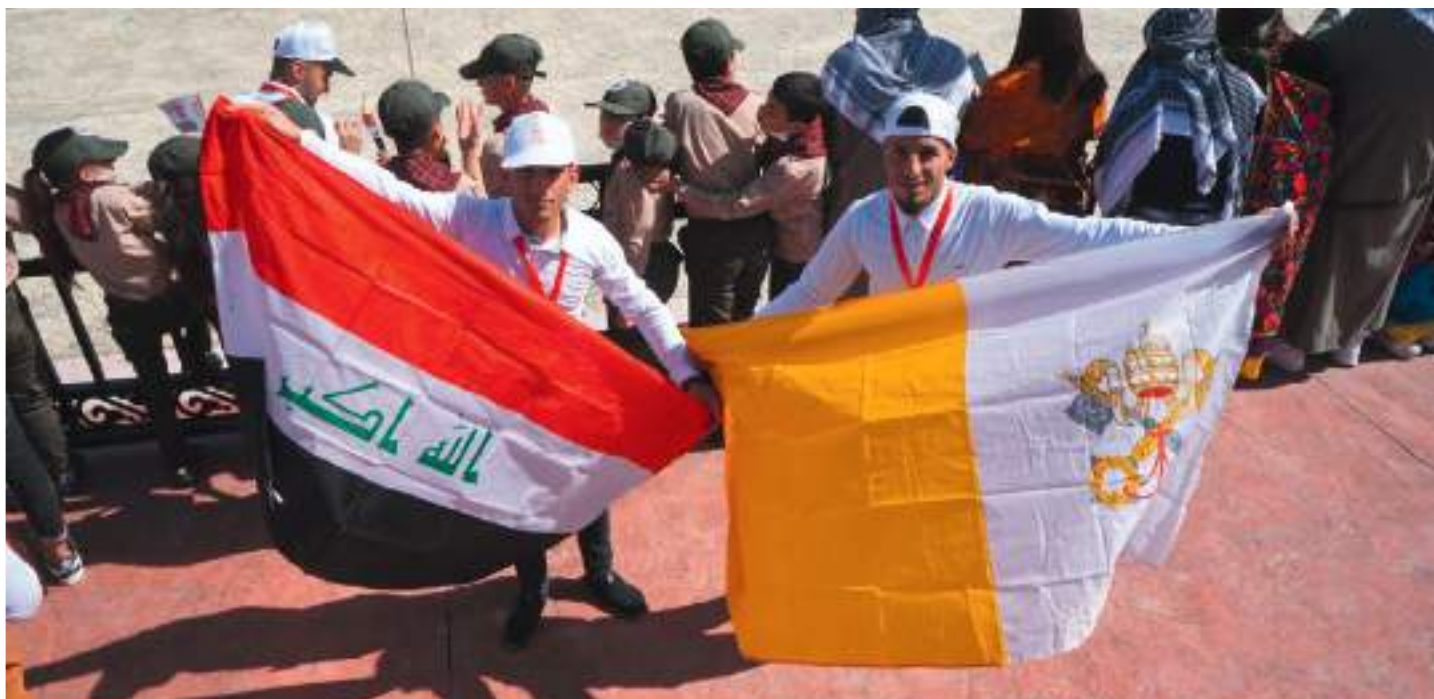
Drapeaux de l'Irak et du Vatican pour accueillir le Pape à Qaraqosh

Si vous avez des projets sur les territoires du Rhône et du Roannais qui relèvent de l'éducation, de la solidarité, de la culture ou de la communication, n'hésitez pas à nous contacter !