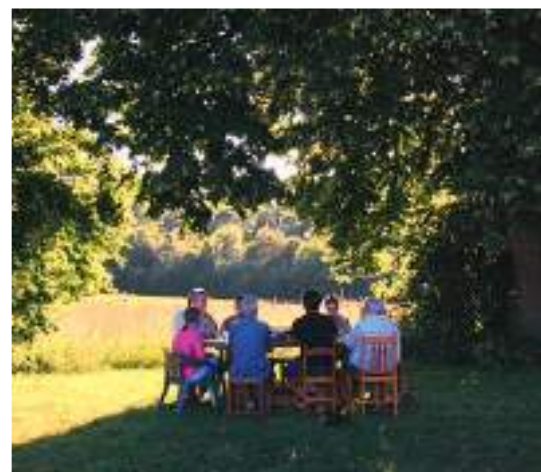
Au Temps Pour Toi permet des moments pour se reconstruire