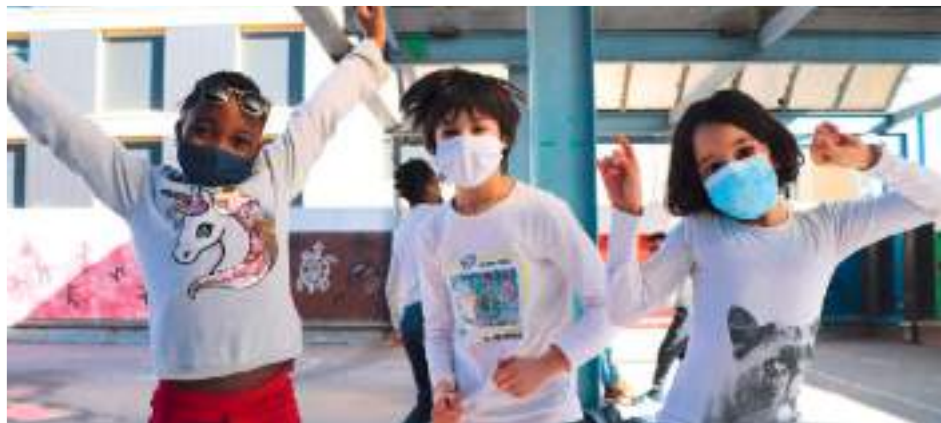
Les ateliers Amasco

De la même façon, les Ateliers Amasco proposent pour leur part des semaines de soutien scolaire organisées pendant les vacances scolaires pour aider les élèves des quartiers et favoriser leur développement intellectuel, social et culturel ; en somme... leur donner envie d'apprendre. Ces ateliers sont animés par des équipes composées d'enseignants, d'étudiants à l'INSPE et de titulaires du BAFA à raison d'un animateur pour quatre enfants. Les élèves de six écoles ont pu participer pendant les vacances d'hiver à ces semaines d'ateliers rythmées par des activités ludiques et pédagogiques. L'objectif est de renforcer leurs savoirs fondamentaux mais aussi de développer leurs compétences psychosociales.