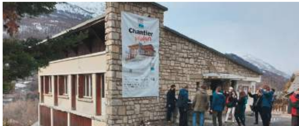
Pose de la première pierre du refuge 82-4000 Solidaires