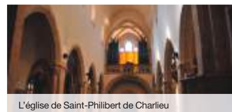
L'église de Saint-Philibert de Charlieu