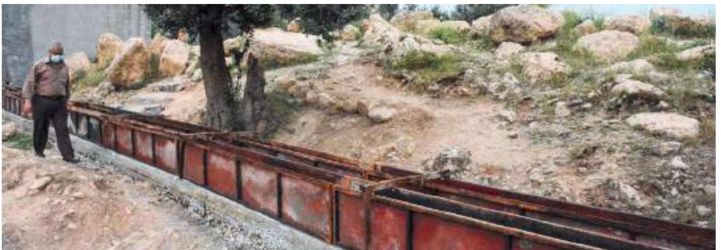
Les nouvelles canalisations mises en place

barrière, les plantations et l'aménagement du site. Ainsi s'achèvera un programme symbolique et fraternel qui bénéficiera à l'ensemble des habitants de Bahzani et qui vise à servir le bien commun irakien.