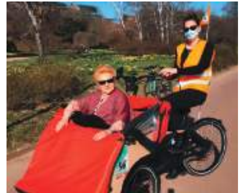
Le triporteur permet une vraie rencontre entre une bénévole et une personne âgée