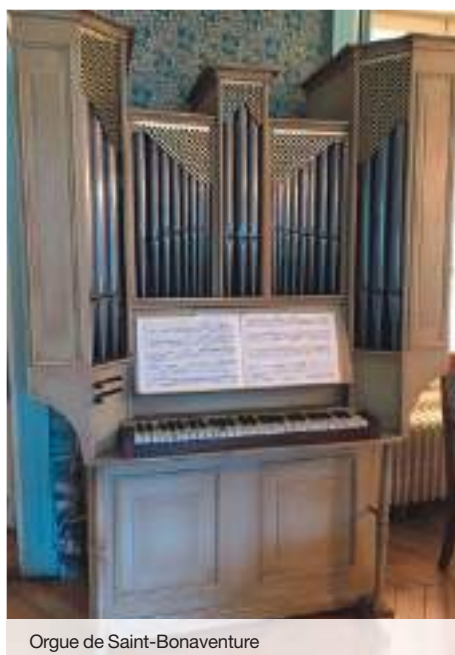
Orgue de Saint-Bonaventure

La Fondation Saint-Irénée soutient depuis sa création de nombreux projets de restauration d'orgues. Au total, ce sont plus de 14 projets qui ont été soutenus pour un montant de près de 660 000 €. Ces projets impliquent des travaux longs et minutieux et mobilisent des moyens importants en complément des financements apportés par les communes propriétaires, l'État ou la région Auvergne-Rhône-Alpes, sans oublier les associations culturelles locales dynamiques.