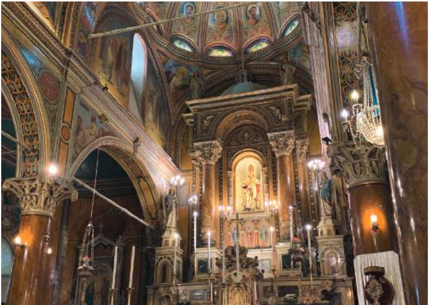
Intérieur de l'église avant le tremblement de terre