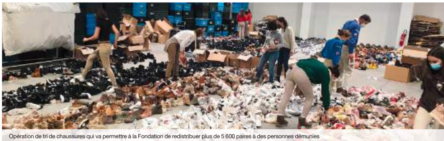
Opération de tri de chaussures qui va permettre à la Fondation de redistribuer plus de 5 600 paires à des personnes démunies

LES DEUX FONT LA PAIRE CHAUSSURES SOLIDAIRES - FONDATION SAINT-IRÉNÉE