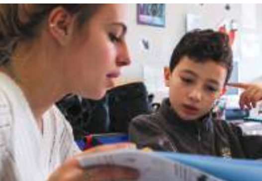
Zup de Co' organise le soutien scolaire