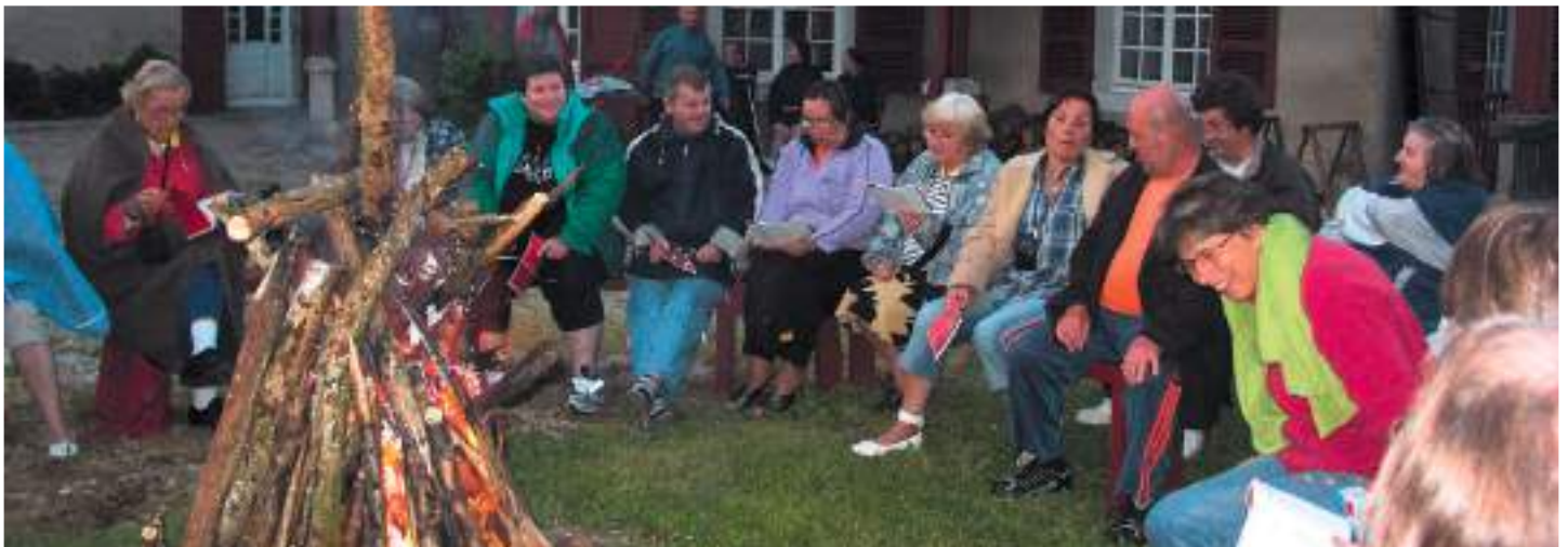
Moment de rencontre et de partage avec Oasis des Familles

Le SAPPEL, à travers le projet « Oasis des Familles », favorise la rencontre entre des familles précaires ou en situation d'exclusion sociale afin de développer leurs ressources pour grandir dans la confiance et le respect. Ces moments favorisent aussi la rencontre avec des familles « partenaires », ce qui permet de s'ouvrir à une altérité, à un chemin fraternel qui nourrit la vie des familles. Ce rapprochement permet aux familles en difficulté de trouver un appui fondamental