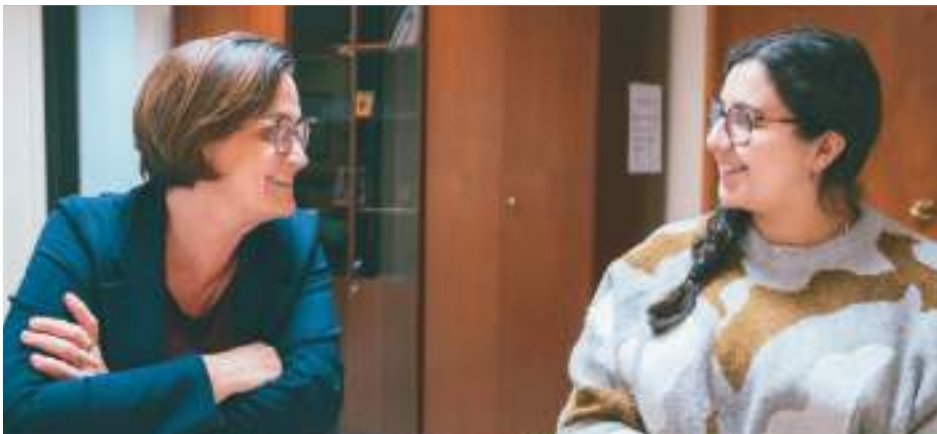
Parrainage par l'association Proximité

D'autres initiatives comme le programme Fil d'Ariane des Apprentis d'Auteuil ont également vu le jour. Il s'agit d'un dispositif qui s'adresse aux jeunes âgés de 16 à 21 ans déscolarisés. Le but est de favoriser leur reprise d'études ou de formation professionnelle à travers la pratique du théâtre. Cette initiative unique développe chez ces jeunes des compétences clés comme la confiance en soi et en les autres, l'expression orale ou encore l'écoute, tout en les sensibilisant à un domaine culturel duquel, souvent, ils sont éloignés.