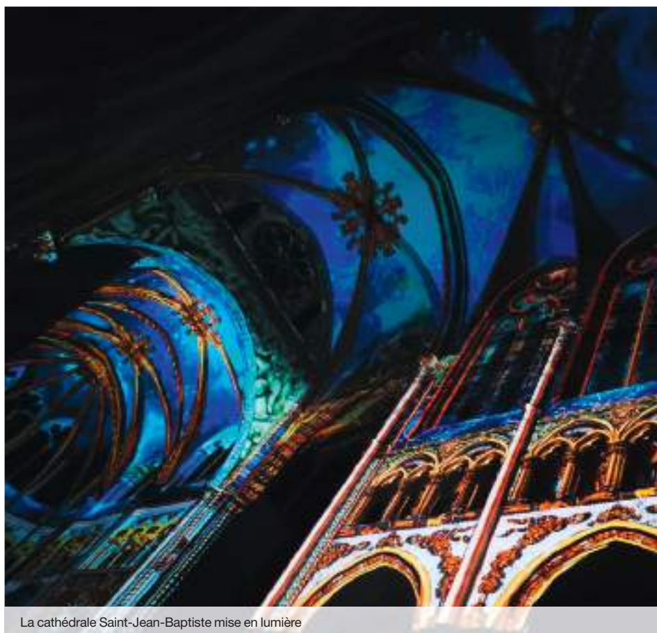
La cathédrale Saint-Jean-Baptiste mise en lumière

L'association Lyon-Cathédrale qui a pour but de faire connaître les valeurs historiques, culturelles, artistiques et spirituelles de la primatiale Saint-Jean-Baptiste, se prépare pour que le spectacle LYON NÉE DE LA LUMIÈRE puisse être présenté au public à l'automne prochain, du 22 octobre au 11 novembre 2021.