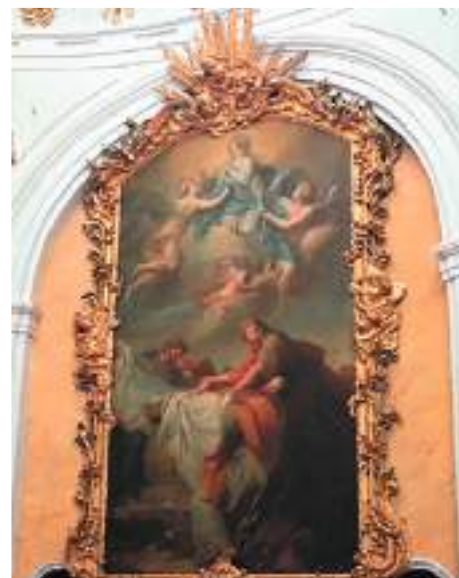
Restauration des tableaux de l'église Saint-Bruno-lès-Chartreux

Ces deux tableaux forment un ensemble exceptionnel et sont considérés comme l'apogée de l'œuvre de l'artiste. Cette action est possible grâce au travail remarquable de l'association Splendeur du Baroque qui porte le projet de rénovation des tableaux et prend