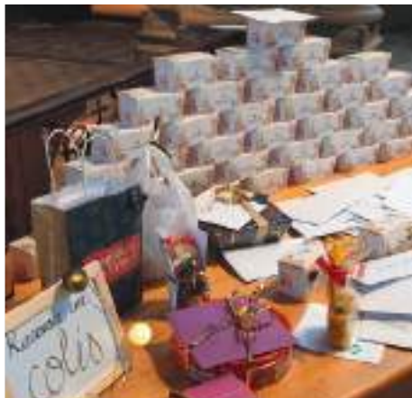
L'Épifree installée dans l'église Saint-André

« L'épicerie gratuite des jeunes à Lyon ! », voilà ce qu'on peut lire en allant sur le site de l'épicerie. La paroisse et l'association Saint-Vincent-de-Paul ont ouvert grâce à des dizaines de bénévoles, et ce depuis quelques semaines, une épicerie au sein de l'église Saint-André, dans le quartier de la Guillotière. Tous les lundis à 18 heures, l'église ouvre ses portes aux étudiants et aux jeunes en situation de fragilité afin de leur proposer de récupérer, gratuitement, des produits alimentaires et des produits d'hygiène. Plus qu'un lieu de distribution, c'est également un lieu d'échange : les bénévoles proposent un temps d'écoute aux jeunes qui ont besoin de parler pour lever un peu le poids qui pèse sur leurs