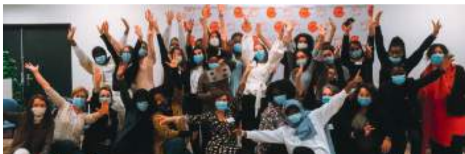
Groupe participant au programme Rêv'elles