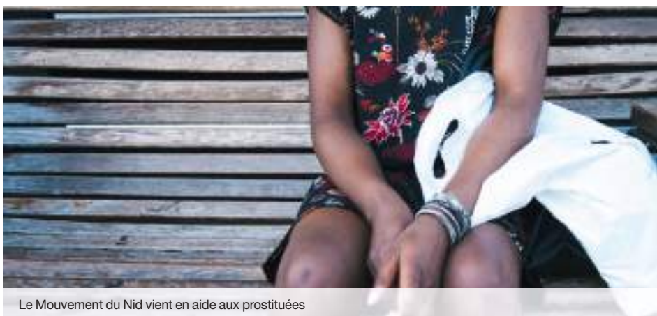
Le Mouvement du Nid vient en aide aux prostituées

La mission du Nid est également de réaliser des actions de prévention auprès des acteurs sociaux et de sensibilisation à l'égalité homme/femme, l'éducation à la vie affective dans les lycées afin de construire un rapport sain à la sexualité. L'association met également en place des maraudes sociales afin de faire connaître leurs actions dans le milieu de la prostitution et d'identifier tous les besoins qui naissent des problématiques précises de ces personnes. À Lyon, une équipe bénévole se mobilise sur le terrain pour créer du lien avec les personnes en situation de prostitution.