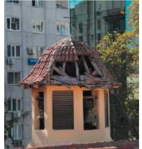
Clocher de l'église Saint-Polycarpe à Izmir après le séisme