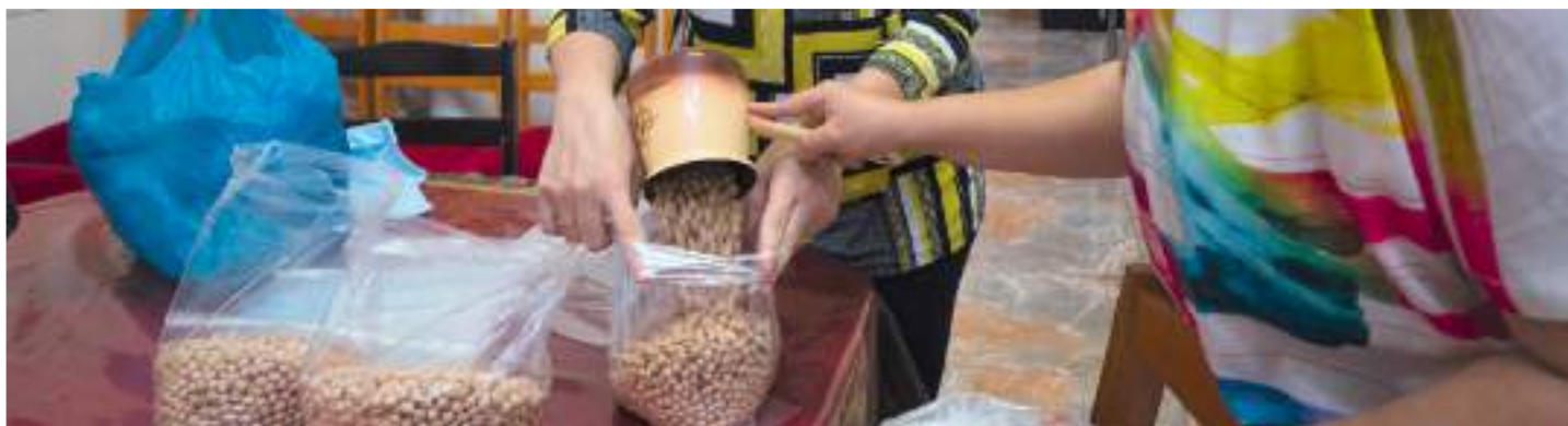
Les bénévoles sont à l'œuvre

nouvel archevêque porte le vœu de réunir les chrétiens, comme « une famille unique sans aucune division, une famille où domine la charité, une famille où le plus fort protège le faible, où le riche nourrit le pauvre et le grand sert le petit. ».