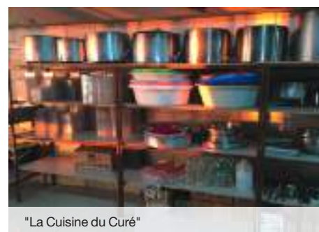
"La Cuisine du Curé"

nouvel archevêque porte le vœu de réunir les chrétiens, comme « une famille unique sans aucune division, une famille où domine la charité, une famille où le plus fort protège le faible, où le riche nourrit le pauvre et le grand sert le petit. ».