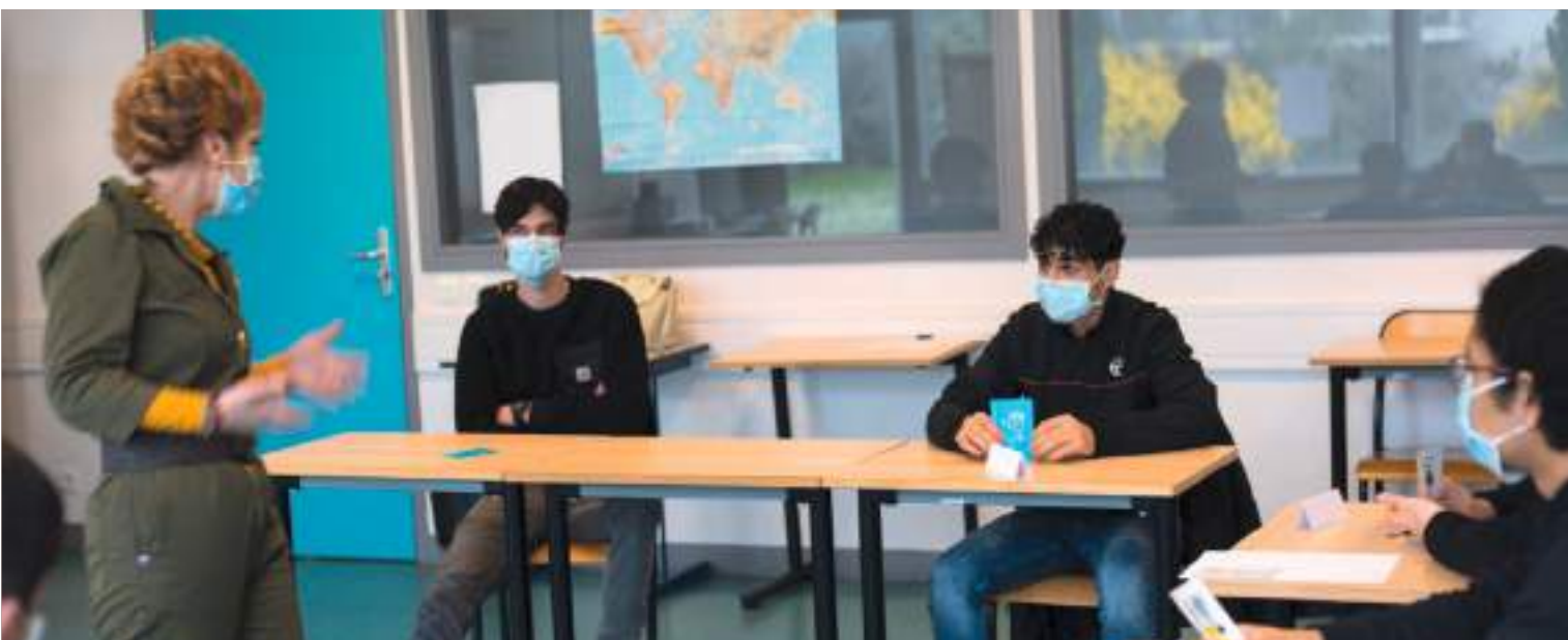
Groupe de jeunes déscolarisés participant à une formation avec Apprentis d'Auteuil