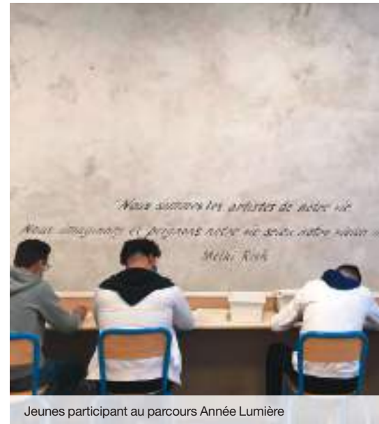
Jeunes participant au parcours Année Lumière