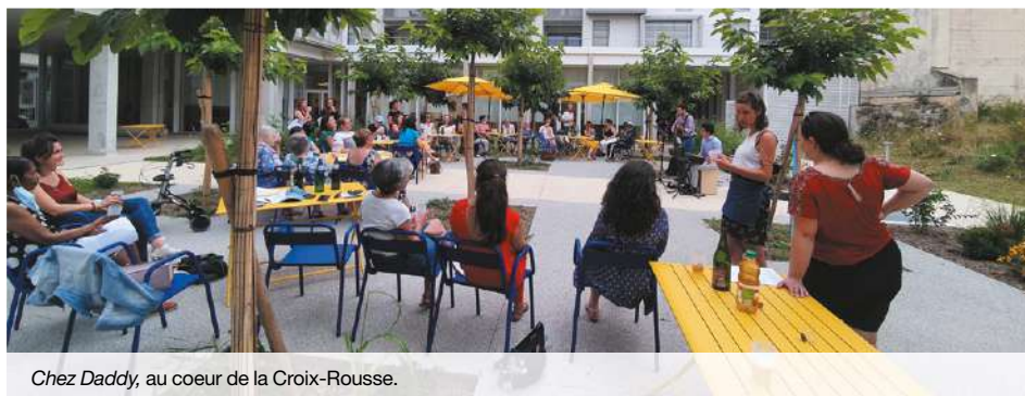
Chez Daddy, au cœur de la Croix-Rousse.

Après le succès du premier café intergénérationnel sous statut associatif « Chez Daddy », qui a ouvert ses portes sur le plateau de la Croix-Rousse, le modèle se duplique et c'est une très bonne nouvelle. L'association Entour'âge Solidaire , à l'origine du premier café qui a accueilli plus de 250 membres depuis octobre 2020, ouvre un second lieu en plein cœur du quartier de Perrache, Cours Suchet, en face des nouveaux bâtiments de l'Université Catholique de Lyon. Installé au rez-de-chaussée d'une Résidence Autonomie (pour les personnes âgées) et mitoyen d'un Centre Communal d'Action Sociale (pour les personnes en situation d'exclusion sociale), le café est aussi proche d'une résidence étudiante, ce qui garantira une riche mixité de publics. Ce mélange de personnes d'horizons extrêmement différents donnera lieu à des rencontres extraordinaires où bienveillance et ouverture seront au rendez-vous dans la superbe cour intérieure du café. Aujourd'hui, plus de 33 % des plus de 75 ans sont en situation d'isolement et cela augmente avec