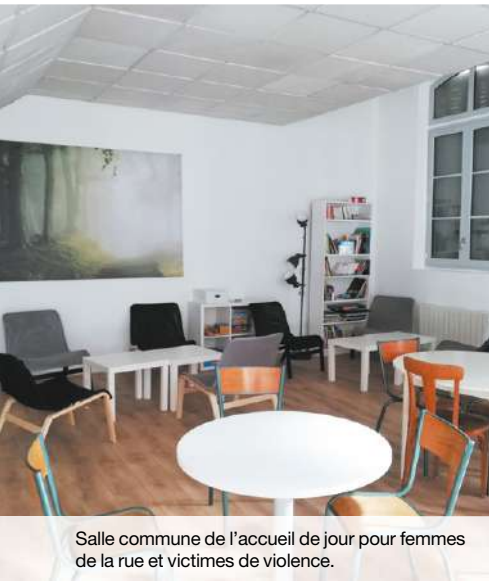
Salle commune de l'accueil de jour pour femmes de la rue et victimes de violence.