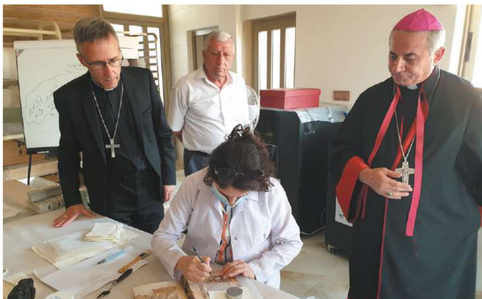
Visite de la délégation lyonnaise au Centre de Numérisation des Manuscrits Orientaux, à Erbil.

Cinquième étape : Bahzani pour l'inauguration de l'oliveraie yézidie, le 30 août 2021, sous un soleil de plomb. Le programme de revitalisation de ce verger de 3 000 oliviers est achevé. Porté par le Centre Culturel et Social Yézidi de Lalesh et placé sous la