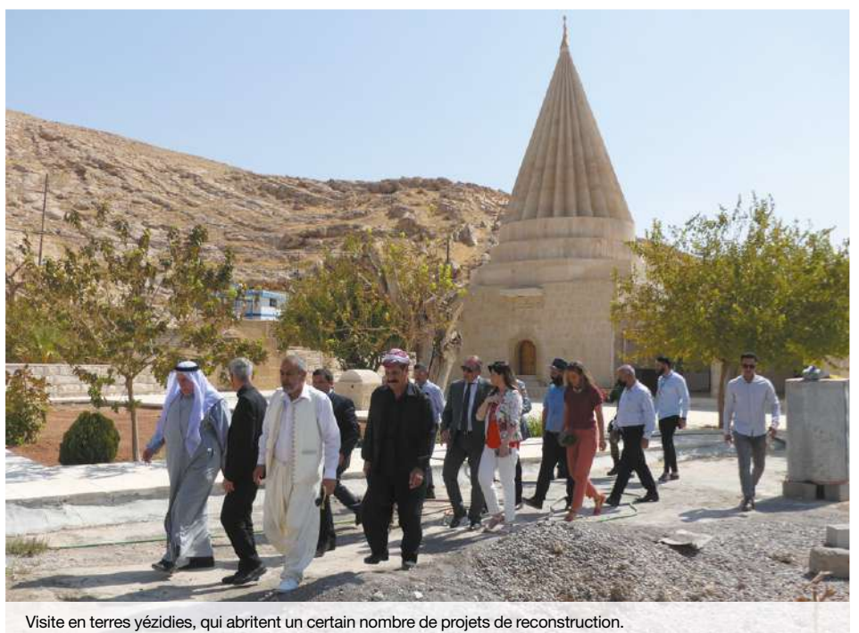
Visite en terres yézidiées, qui abritent un certain nombre de projets de reconstruction.