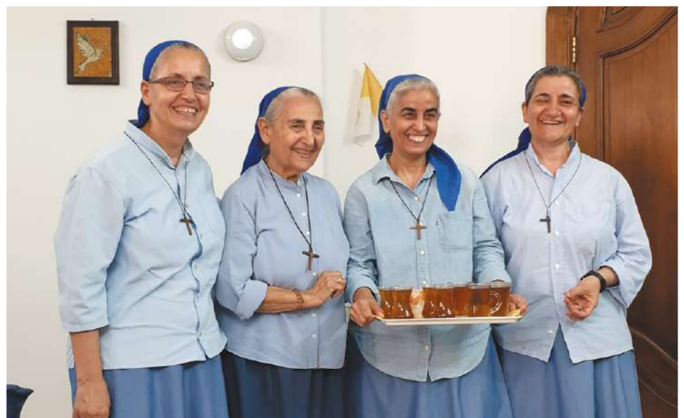
Les Petites Sœurs de Jésus.

Le Centre Saint Paul, défiguré par daesh, est à présent totalement opérationnel. La Fondation Saint-Irénée qui avait financé l'intégralité de sa rénovation et de sa réhabilitation, va également prendre en charge l'air conditionné de l'amphithéâtre.