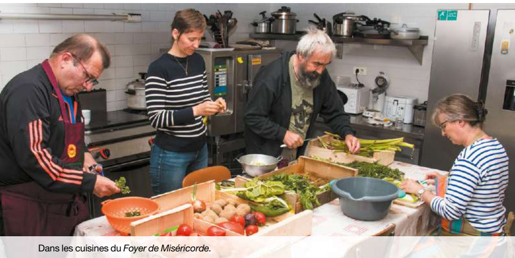
Dans les cuisines du Foyer de Miséricorde.

Soutenu en 2020 pour le lancement de son activité, le Foyer de Miséricorde, installé dans l'ancien orphelinat d'Ars, fête sa première année d'existence. Disposant d'une dizaine de chambres, le Foyer a pu