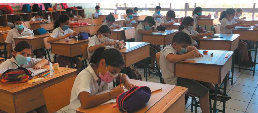
Visite du comité de jumelage en septembre 2021 dans l'une des écoles jumelées avec un établissement lyonnais

Face à cette situation, le comité du jumelage Lyon-Antélias a décidé de mener une action importante pour favoriser l'accès à l'éducation et l'enseignement des jeunes Libanais