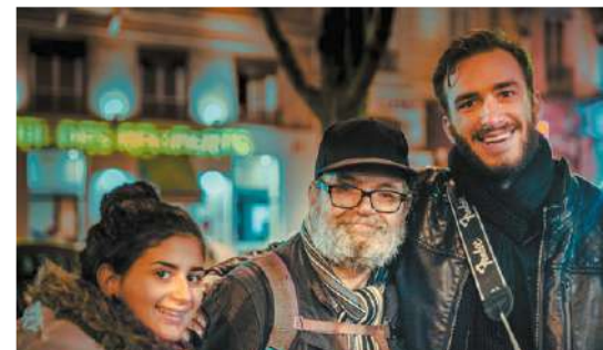
Rencontre au cours d'une maraude.