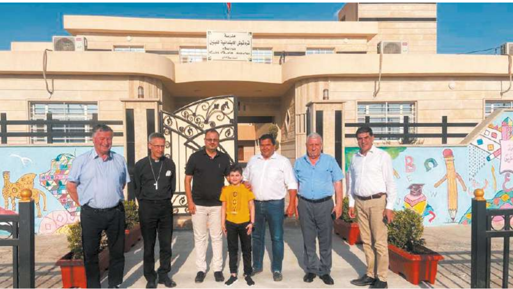
Visite dans l'école publique de Qaraqosh, intégralement reconstruite grâce au soutien de la Fondation Saint-Irénée, la Fondation Mérieux, la Fondation Raoul Follereau et la région Île-de-France.

L'école publique Qaraqosh 1 a été intégralement reconstruite, grâce au cofinancement des fondations Saint-Irénée, Mérieux et Raoul Follereau avec la région Ile de France. Fermée pendant le confinement sanitaire, la voici fin prête à accueillir des centaines d'enfants de Qaraqosh.