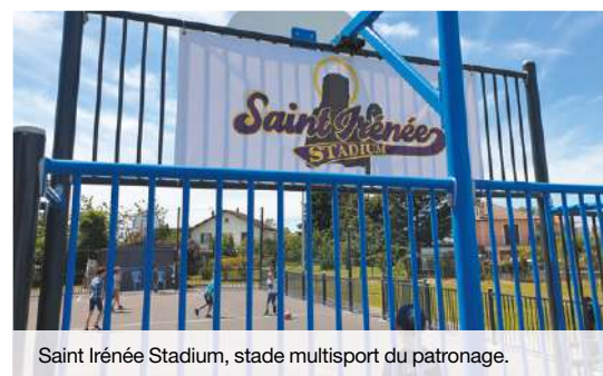
Saint Irénée Stadium, stade multisport du patronage.