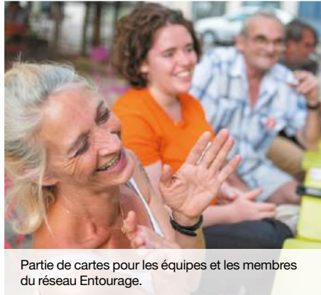
Partie de cartes pour les équipes et les membres du réseau Entourage.

L'association est aujourd'hui bien implantée dans Lyon, le réseau compte 6 000 membres. Les actions passent par des ateliers de sensibilisation (qui ont concerné plus de 250 Lyonnais en 2020), des outils numériques