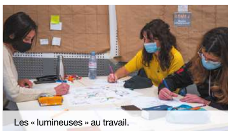
Les « lumineuses » au travail.

En 2020, la Fondation Saint-Irénée a financé deux « programmes courts », de janvier à juillet pour des jeunes en situation de fragilité. Les 6 mois ont vu s'alterner temps d'éducation formelle (apprentissage scolaires) et informelle (apprentissage liés à la vie quotidienne), le programme étant construit autour de trois axes : la connaissance de soi, la découverte d'environnements scolaires et professionnels