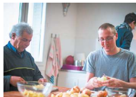
Moment de complicité dans la colocation lyonnaise.

Puisque les initiatives qui méritent d'être mentionnées ne manquent pas, le jury a décidé d'accorder un prix coup de cœur ex-aequo à l'association Lazare pour le projet humain et généreux qu'elle porte. L'intuition de cette association est de mettre en action la fraternité et l'entraide, à travers l'ouverture de colocations partagées entre des personnes issues de la rue et des jeunes actifs. C'est ainsi une petite dizaine de « colocs » qui partagent dans chaque colocation un bout de chemin et qui font l'expérience d'un vivre-ensemble unique, teinté de solidarité, de moments touchants et de bienveillance. À Lyon, ce sont six femmes et seize hommes issus de la rue qui cohabitent avec autant de jeunes actifs. Le projet récompensé est celui d'un accompagnement social pour les personnes sortant de la rue, dans le but de lutter contre leurs addictions diverses, mais