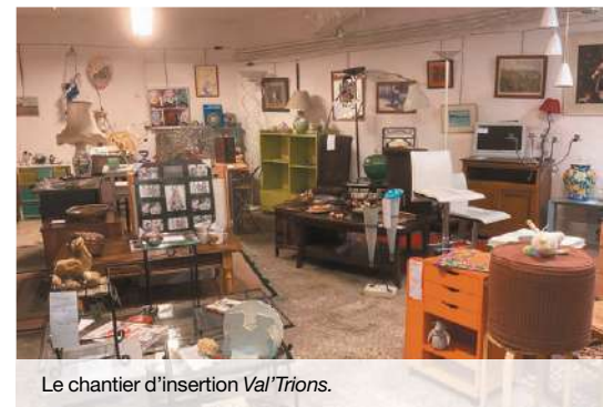
Le chantier d'insertion Val' Trions.