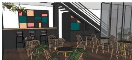
Les futurs locaux de 1000 vies.

Forte de ce succès, l'une des administratrices de Chez Daddy a décidé de dupliquer le modèle à travers une nouvelle association, 1000 vies , qui s'implante à Saint-Genis-Laval au sud-ouest de Lyon. Cette ville de périphérie fait, elle aussi, face à des défis