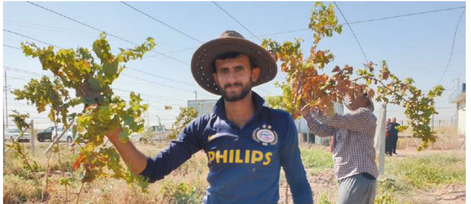
Les vignes de Karamless, revitalisées avec le soutien de la Fondation Saint-Irénée.