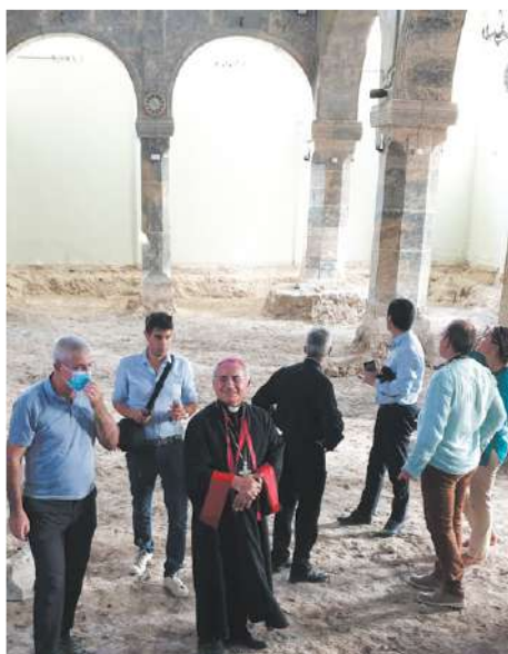
Ruines de la cathédrale chaldéenne Al-Tahira.

Deux jours plus tard, le mardi 31 août la délégation lyonnaise est retournée à Mossoul, guidée par Monseigneur Najeeb Michael son archevêque chaldéen, pour voir ce qu'il reste du corps décharné de cette cité où les êtres humains et le patrimoine ont subi toutes sortes de violations. Dans les ruelles et les venelles de la vieille ville, entre l'ancien patriarcat et l'église Saint-Georges, il reste du vieux quartier chrétien un charme indéniable encore perceptible mêlé au sentiment douloureux d'une histoire volée et d'un temps révolu. Aux portes de la ville moderne, dans l'église chaldéenne dévastée du Saint-Esprit, Mgr Monseigneur