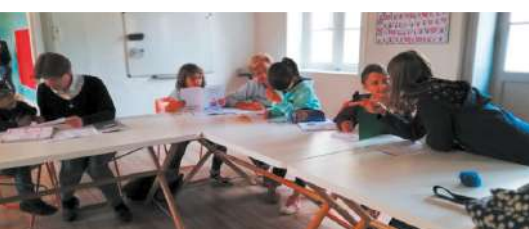
Aide aux devoirs dans le patronage Saint-Martin.