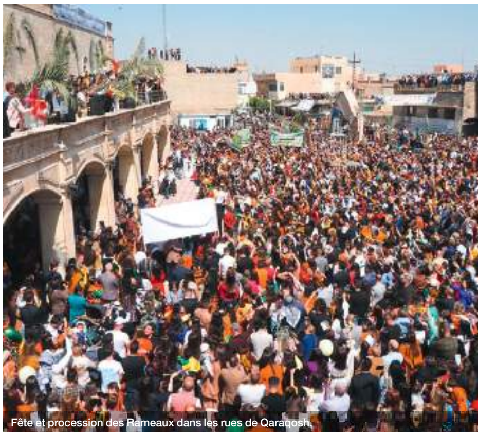
Fête et procession des Rameaux dans les rues de Qaraqosh.