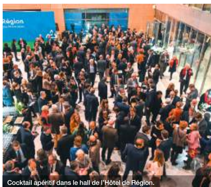
Cocktail apéritif dans le hall de l'Hôtel de Région.