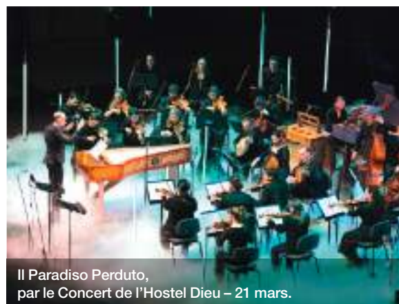
Il Paradiso Perduto, par le Concert de l'Hostel Dieu – 21 mars.