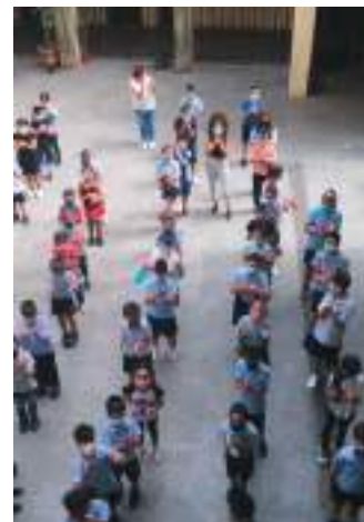
Les élèves de l'école Saint-Joseph de Bourj Hammoud, l'une des paroisses les plus pauvres du diocèse ; l'école est jumelée avec l'école Saint-Joseph des Brotteaux de Lyon.