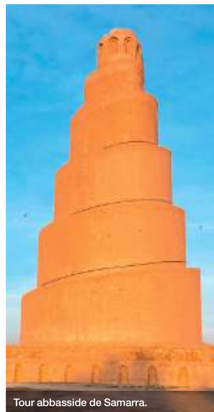
Tour abbasside de Samarra.

Les deux cardinaux s'inclinent pour laver les pieds de 8 jeunes Irakiens et 4 Français de notre groupe, geste tellement émouvant, qui reprend celui de Jésus et contient tout l'amour, le soutien et le service mutuels entre nos deux pays. »