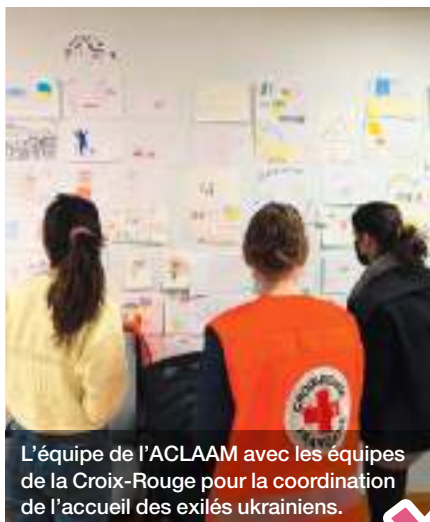
L'équipe de l'ACLAAM avec les équipes de la Croix-Rouge pour la coordination de l'accueil des exilés ukrainiens.