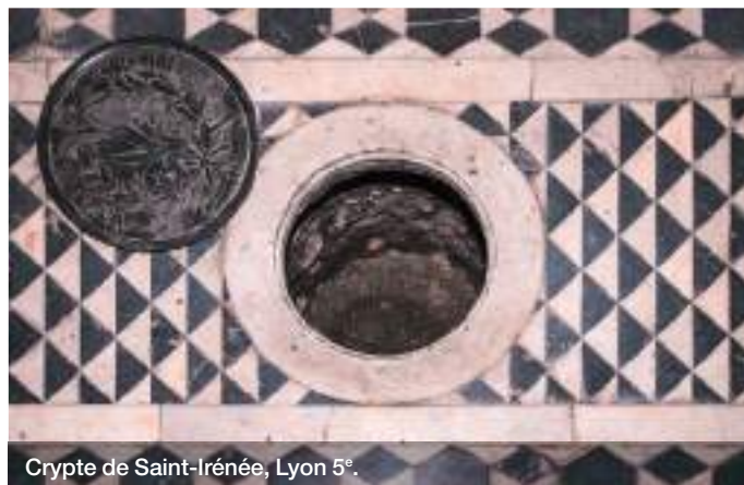
Crypte de Saint-Irénée, Lyon 5 e .

Après des années de travaux, la crypte de l'église Saint-Irénée est prête à révéler ses secrets et ses trésors. Récemment rouverte au public (avant d'être refermée pour des fouilles complémentaires !), la crypte, qui fait partie du monument religieux le plus ancien de Lyon encore en activité, est un témoignage saisissant de l'Histoire des premiers chrétiens de Lyon.