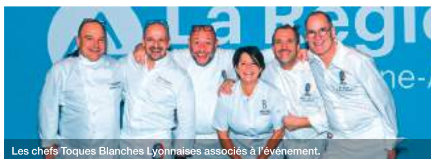
Les chefs Toques Blanches Lyonnaises associés à l'événement.