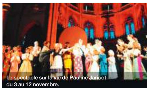
Le spectacle sur la vie de Pauline Jaricot – du 3 au 12 novembre.