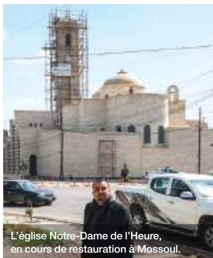
L'église Notre-Dame de l'Heure, en cours de restauration à Mossoul.