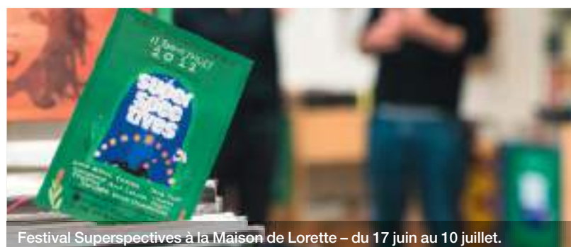
Festival Superspectives à la Maison de Lorette – du 17 juin au 10 juillet.