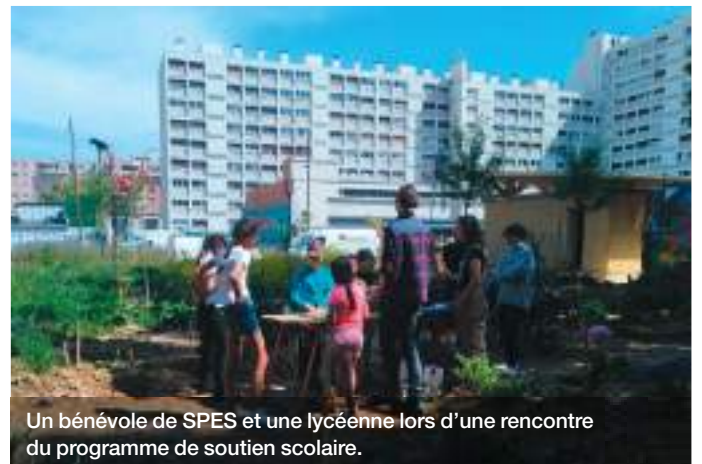
Un bénévole de SPES et une lycéenne lors d'une rencontre du programme de soutien scolaire.

➤ SOUTIEN DE LA FONDATION POUR TROIS ANS : 30 000 €