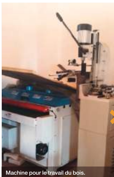
Machine pour le travail du bois.