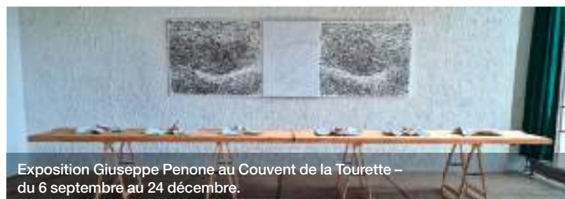
Exposition Giuseppe Penone au Couvent de la Tourette – du 6 septembre au 24 décembre.

De nombreux événements culturels, accompagnés par la Fondation, ont animé la vie lyonnaise en 2022.