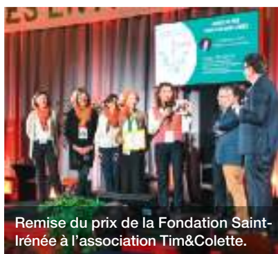
Remise du prix de la Fondation Saint-Irénée à l'association Tim&Colette.