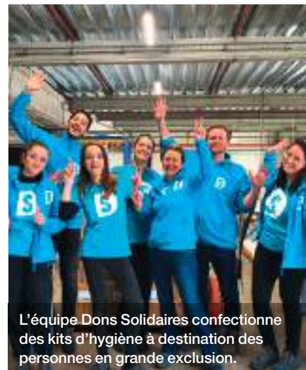
L'équipe Dons Solidaires confectionne des kits d'hygiène à destination des personnes en grande exclusion.

Après un diagnostic du territoire, l'association a décidé de créer sa première antenne autonome en Auvergne-Rhône-Alpes afin de capter des entreprises plus petites et d'intégrer les réseaux locaux de solidarité dans une démarche de décentralisation. Soutenue par un réseau de bénévoles, l'antenne est en phase de