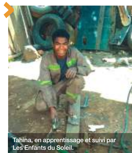
Tahina, en apprentissage et suivi par Les Enfants du Soleil.

La Fondation continue de soutenir les projets à destination des jeunes de l'île rouge. Après un premier soutien en 2017, les administrateurs ont à nouveau octroyé une subvention à l'association Les Enfants du Soleil pour le développement d'un « fonds apprentissage » afin d'accompagner les jeunes vers des formations professionnalisantes. Ce programme vise particulièrement les adolescents en décrochage scolaire ou les jeunes au profil très manuel, pour bâtir leur projet de vie dans des filières qui recrutent, grâce à une formation de 18 à 36 mois. Ce projet a démarré début 2023 et a permis déjà à 77 jeunes de faire des stages de découverte ou de suivre des formations. Certains sont également accompagnés dans leur recherche d'emploi ou dans leur première embauche.