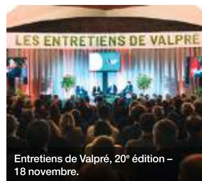
Entretiens de Valpré, 20 e édition – 18 novembre.