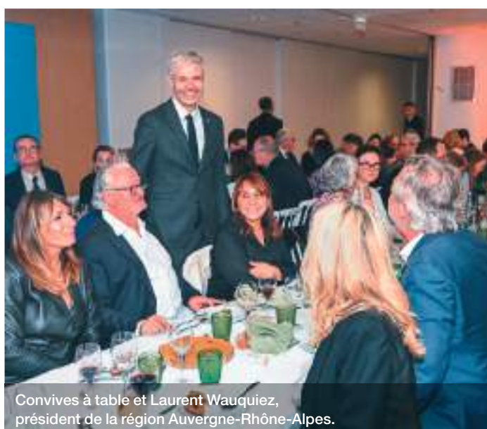
Convives à table et Laurent Wauquiez, président de la région Auvergne-Rhône-Alpes.