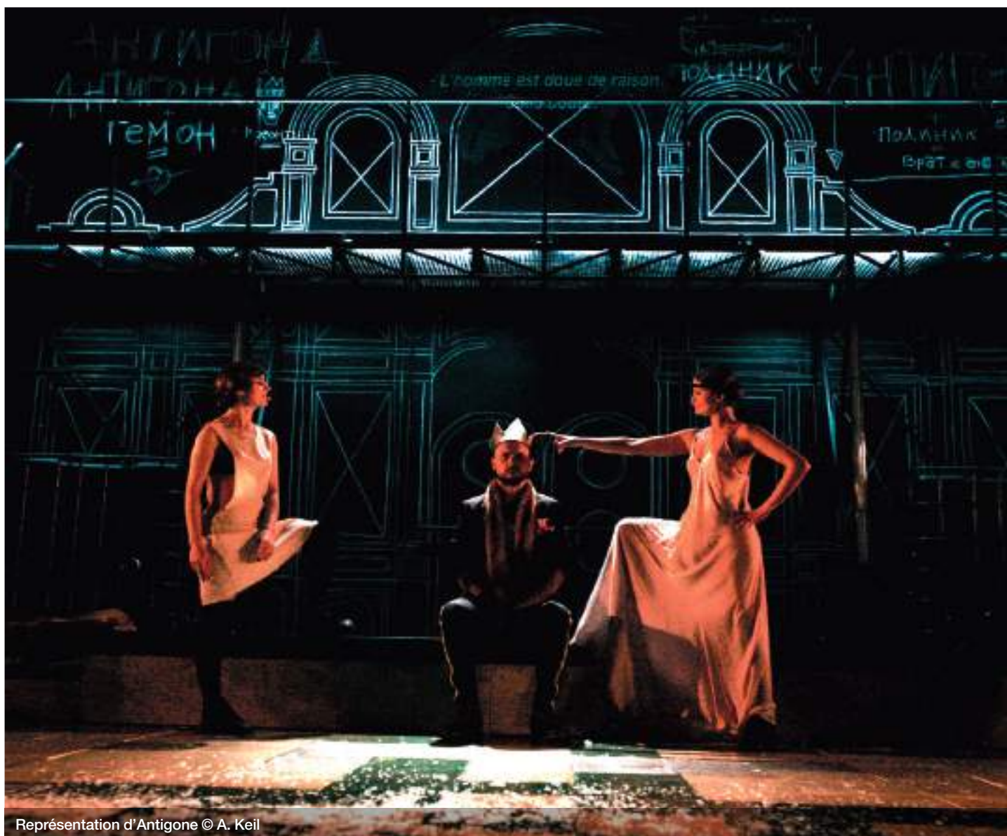
Représentation d' Antigone