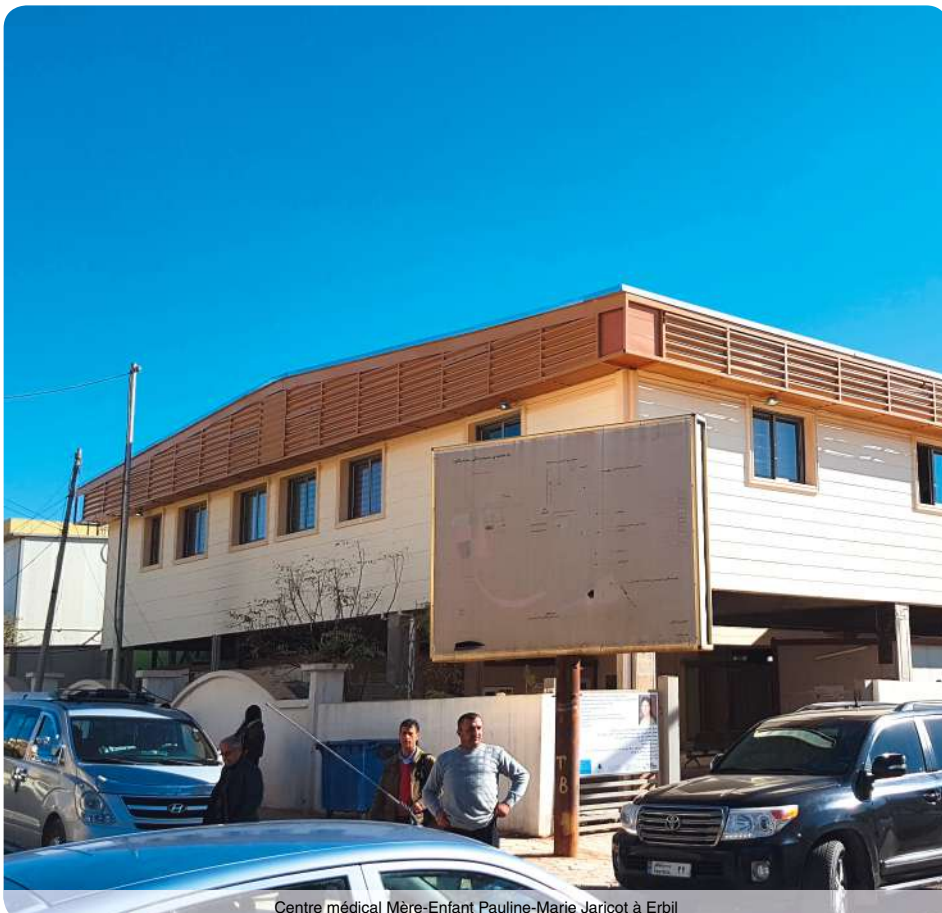
Centre médical Mère-Enfant Pauline-Marie Jaricot à Erbil