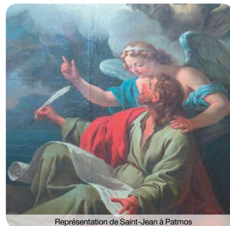
Représentation de Saint-Jean à Patmos

J'ai travaillé pendant 8 ans comme attachée-conservateur des antiquités et des œuvres d'art avant d'arriver en septembre 2015 à Lyon. Je dirige la commission d'art sacré et