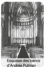
Esquisse des bancs d'Andrée Putman