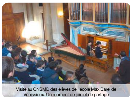
Visite au CNSMD des élèves de l'école Max Barel de Vénissieux. Un moment de joie et de partage

La musique comme langage universel et instrument de développement de l'enfant