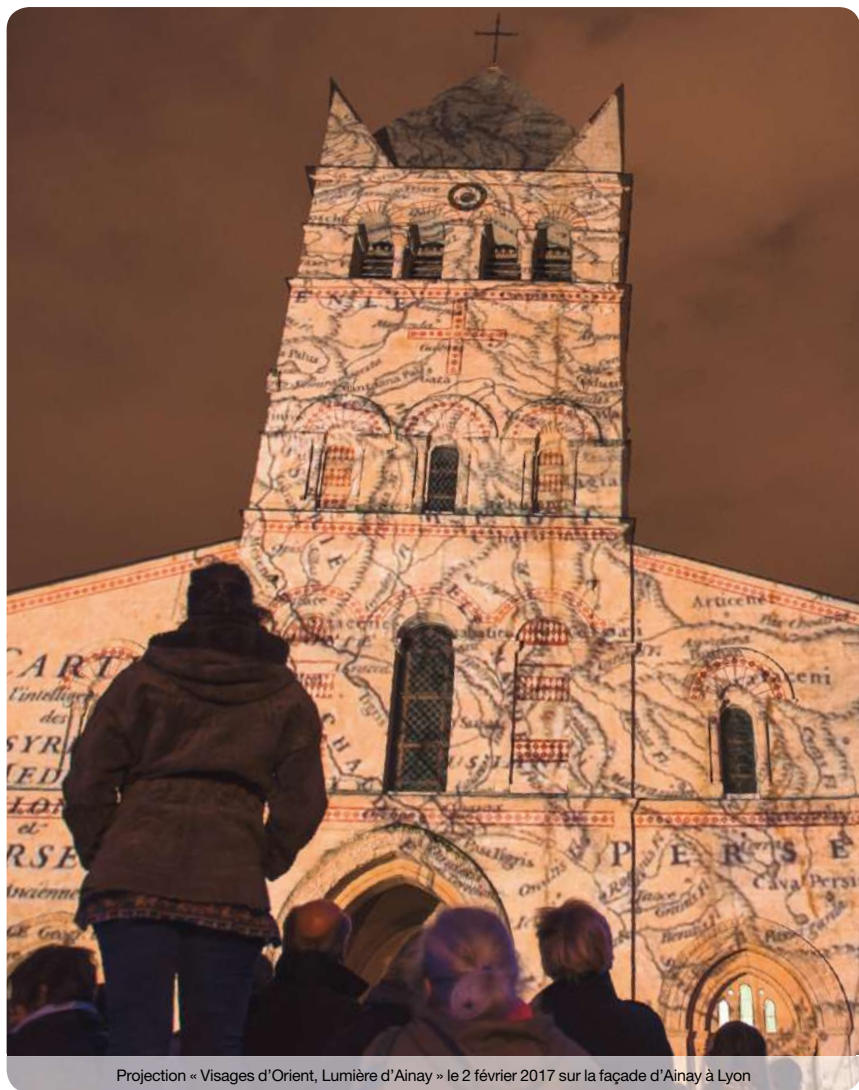
Projection « Visages d'Orient, Lumière d'Ainay » le 2 février 2017 sur la façade d'Ainay à Lyon

Dans le cadre du jumelage de Lyon avec Mossoul et pour célébrer la fête liturgique de la lumière, les 2 et 3 février, un spectacle son et lumière réalisé par Cor quo Vado – Agnès Winter – a présenté 3 000 ans d'histoire de la Mésopotamie. Cette projection, initialement prévue pour le 8 décembre 2015 dans le cadre de la fête des lumières, a permis de marquer de nouveau l'engagement et l'amitié des Lyonnais auprès des populations déplacées de la plaine de Ninive en Irak.