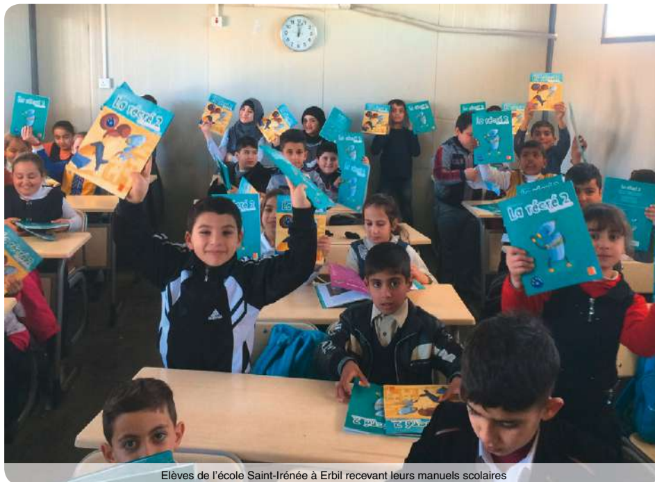
Elèves de l'école Saint-Irénée à Erbil recevant leurs manuels scolaires